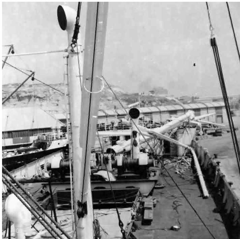
Das ganze Ausmass der Havarie