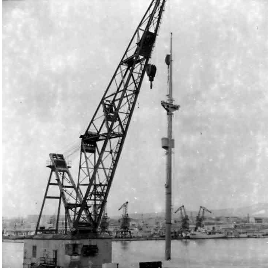
Der neue Mast wird mit einem Schwimmkran eingesetzt