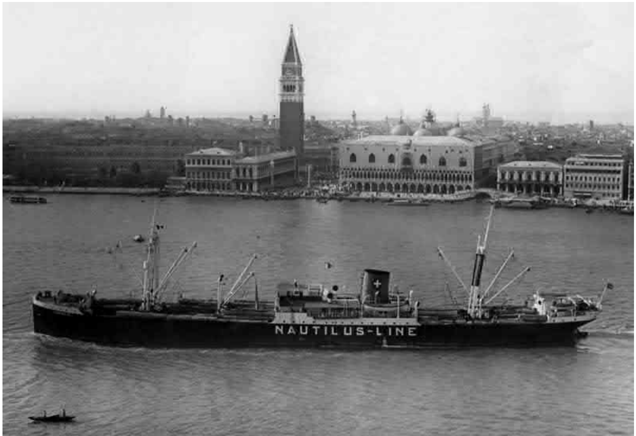
Die SAENTIS läuft 1959 mit "Logs" (Baumstämmen) aus Westafrika in Venedig ein