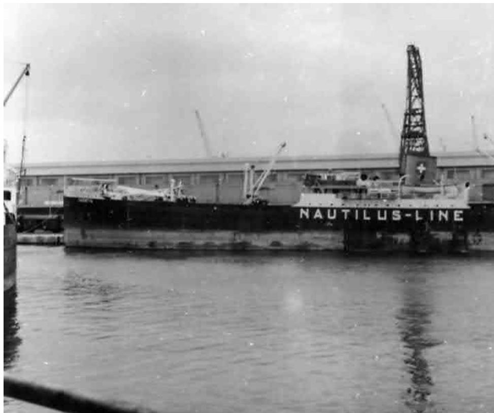
Ohne Vormast Die SAENTIS nach der Havarie im Hafen von Marseille

SwissShips-HPS, Kapt. P. Accola, April 2012