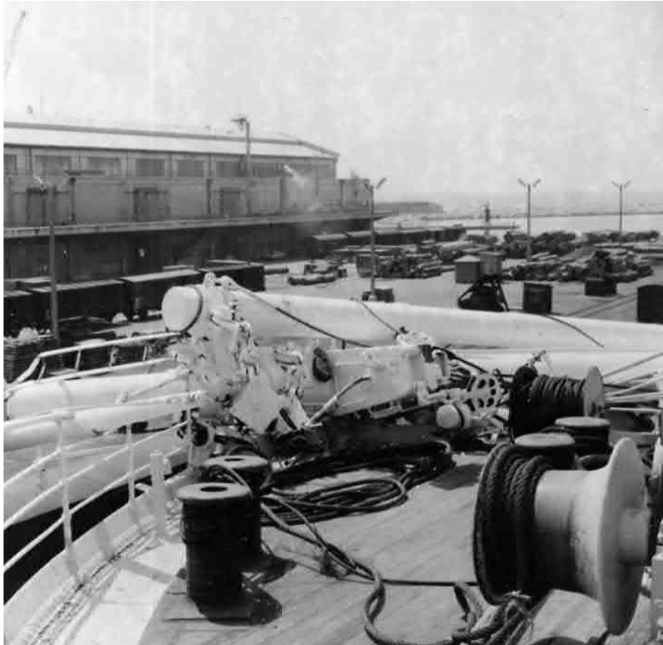
Nach der Havarie im März 1959 in Marseille