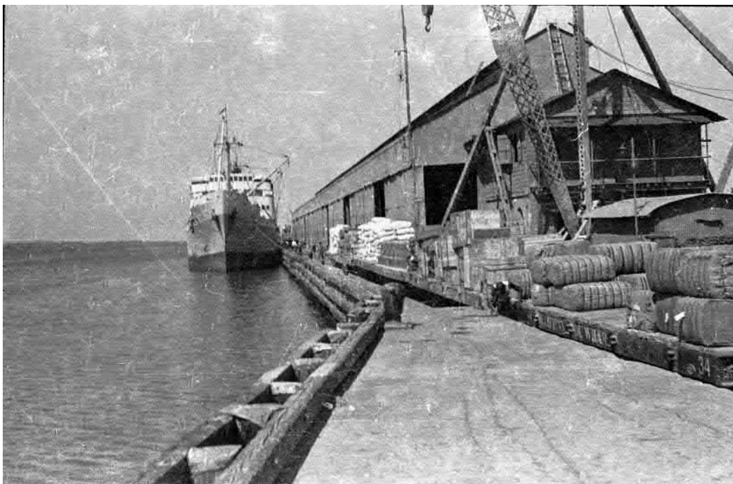
Die Pier in Port au Prince, dem Endpunkt der Reise. Nach Antwerpen ging es zuerst nach San Juan, Fort-de-France in Martinique, La Guaira and Puerto Cabello in Venezuela, Aruba, und Barranquilla in Kolumbien. / The pier in Port au Prince, the final destination of the voyage. From Antwerp the trip first went to San Juan, Fort-de-France in Martinique, La Guaira and Puerto Cabello in Venezuela, Aruba, and Barranquilla in Columbia.