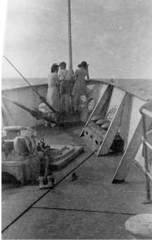
Springen die Delfine in der Bugwelle? / Are dolphins jumping ahead of the bow wave?