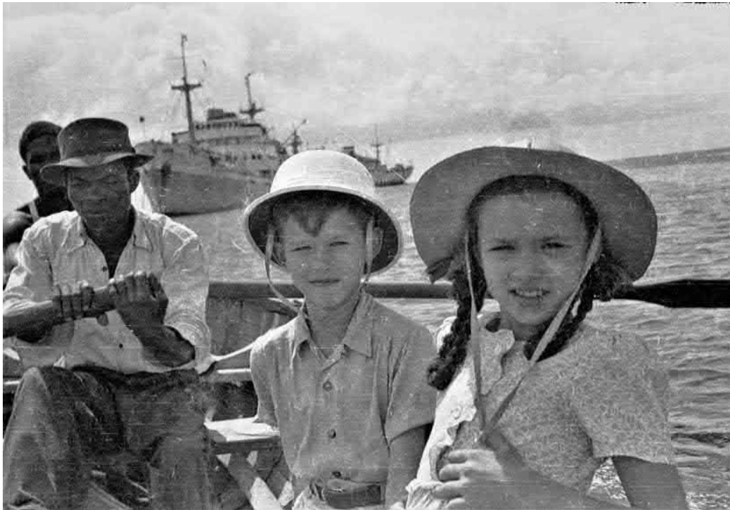
Landgang in Westindien, noch fährt man gemütlich im Ruderboot zurück an Bord/ Back to the ship in a rowing boat