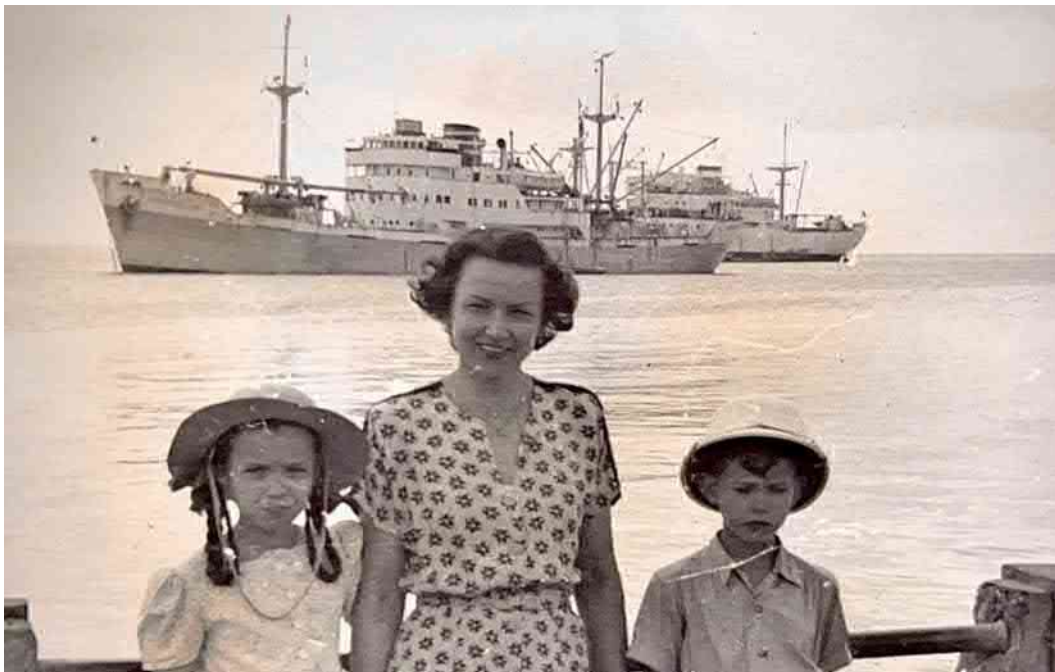
In Westindien, endlich an Land in Fort-de-France, Martinique. Im Vordergrund die CRISTALLINA / In the West Indies, finally on shore in Fort-de-France, Martinique. The ship in the foreground is the CRISTALLINA