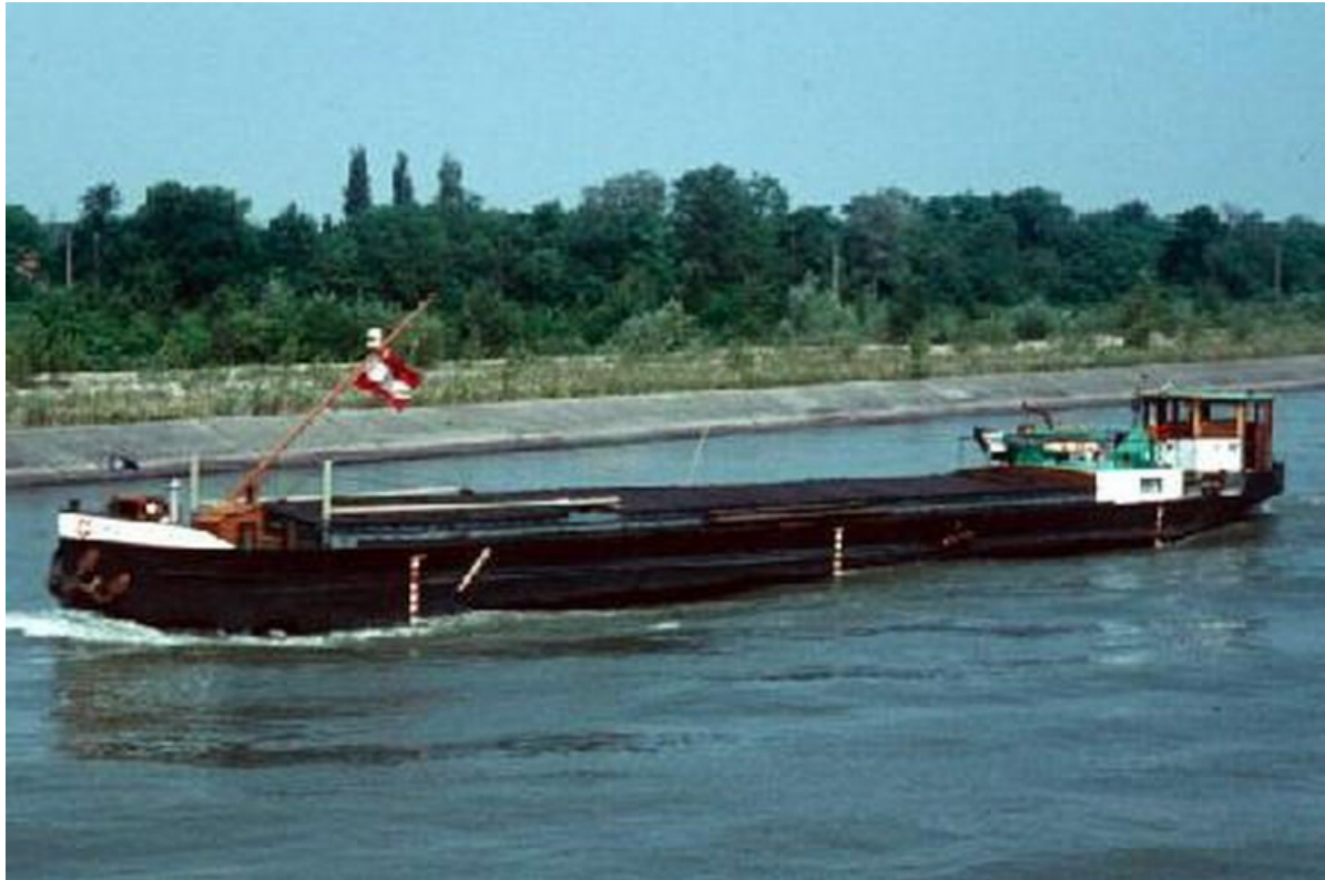
GMS „NAVI-FER 4“

Ist am 13.06.1968 ins Ausland verkauft worden, weiterer Verbleib unbekannt.